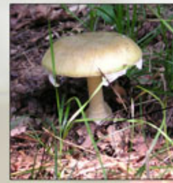
>Een dodelijk giftige: de groene knolamaliel

Sommige paddenstoelen zijn eetbaar en de bekendste is natuurlijk de champignon, maar de meeste zijn smakeloos, of hebben een scherpe smaak of zijn vies. Sommige paddenstoelen zijn heel erg giftig. Je kan er erg ziek van worden, overgeven en diarree van krijgen, maar sommige zijn zelfs zo giftig dat je er heel snel dood aan gaat! In Nederland bestaan ongeveer 30 soorten giftige, waarvan 7 dodelijke paddenstoelen. Het vreemde is dat sommige dieren van die giftige paddenstoelen helemaal niet ziek worden terwijl een mens er aan dood kan gaan!