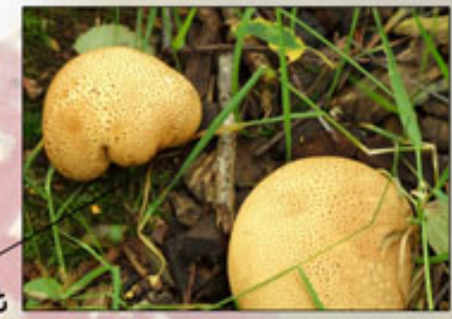
>Ook giftig: aardappelbovist