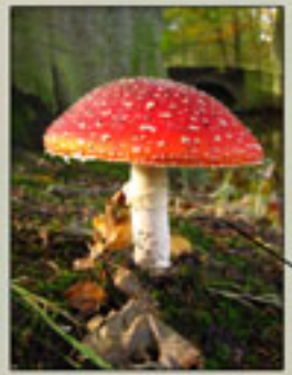
>Nog een giftige: de vliegzwam

Sommige paddenstoelen groeien in cirkels, deze cirkels worden heksenkringen genoemd. Vroeger dacht men dat deze ontstonden na een rondedans van heksen. In andere streken van Europa geloofden de mensen, dat op deze plaatsen een staart van een draak de grond had geraakt.